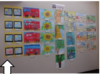
帯広市民ギャラリー「小中学校造形展」つつじが丘小のコーナー。