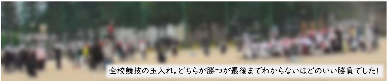
全校競技の玉入れ。どちらが勝つが最後までわからないほどのいい勝負でした!