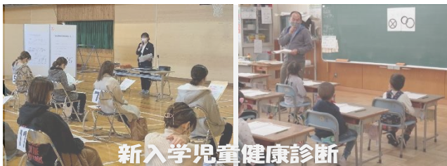
新入学児童健康診断

市内でも小学生を狙った不審者情報がいくつかありました。 不審者に関する情報は、まず、すぐ警察へ、その後、学校へもご一報ください。