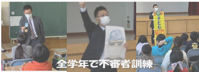
全学年で不審者訓練

帯広警察署生活安全課に講師を依頼し、全学年で不審者訓練を行いました。見かけだけで大丈夫と判断せず、怪しいと感じたら距離を取り、大声を出したり、子ども110番の家に逃げ込んだりすることを学びました。