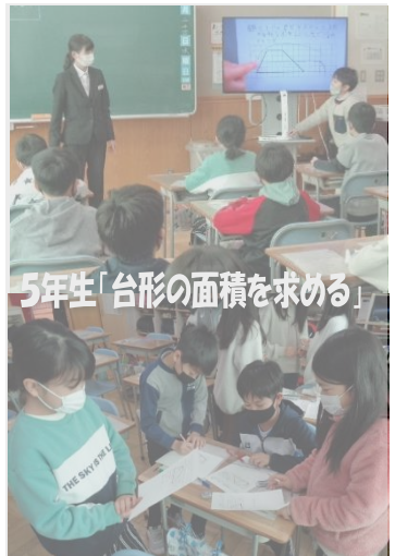
5年生「台形の面積を求めよう」

今年は「主体的に考え、表現する力を育てる算数授業の創造」を目指し、理論研修・実践研修に取り組んでいます。今月は5年生で台形の面積の求め方を題材にした研究授業が行われました。図と式を結び付けて、友達と説明し合いながら考えを整理することができていました。