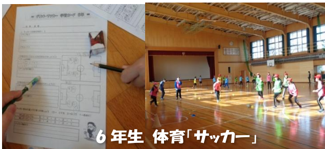
6年生 体育「サッカー」

来年度入学予定37名の子供たちが就学時健診で来校しました。例年2月の一身体験入学が今年度は実施できませんので、次に子供たちに会えるのは入学式になりますね。