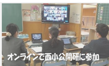
オンラインで西小公開研に参加

また、今年は二中エリアの取組として西小の公開研究会に全職員で参加しました。オンラインでの参加は、まだちょっと緊張します。小中9年間で目指す子どもたちの姿を3校で共有して連携を図っていきます。