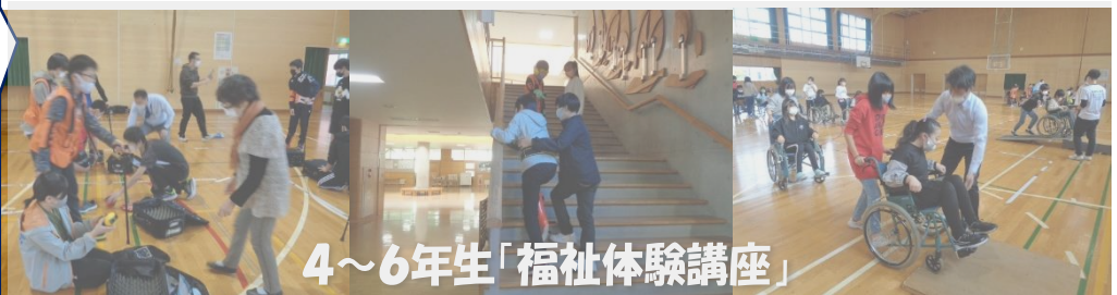
4～6年生「福祉体験講座」

車椅子の乗車やサポート、装具を使った手足や耳・目の不自由さを体験しました。ちょっとした段差やスロープでもかなり不便だと実感しました。