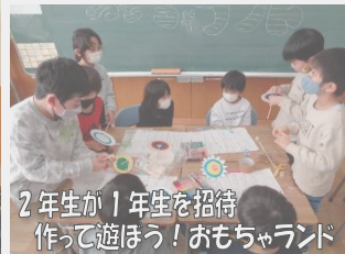
2年生が1年生を招待 作って遊ぼう!おもちゃランド