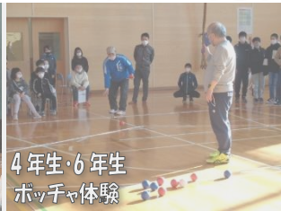
4年生・6年生 ポッチャ体験