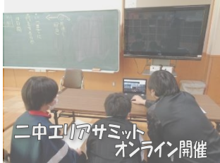
二中エリアサミット オンライン開催