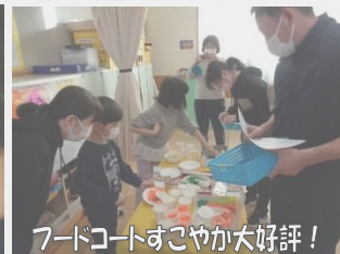
フードコートすこやか大好評!