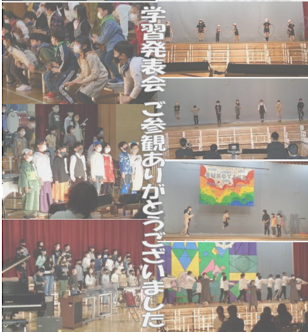
学習発表会 ご参観ありがとうございました